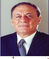
لواء د. سمير فرج